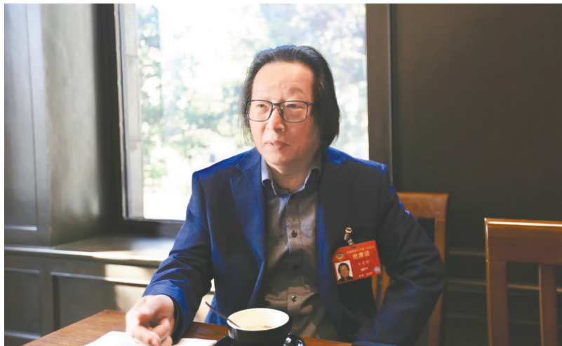
全国政协委员、中国纪录片学会副会长王建国接受封面新闻专访，讲述拍摄纪录片《长江之歌》的幕后故事。