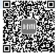
扫描二维码 看更多股市新闻