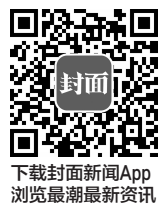
下载封面新闻App 浏览最新资讯

场要求设备停止使用,并责令立即整改。据了解,达州市市场监管局自去年1月成立以来,结合“春雷行动”加强监管,严格执法,切实以“人民为中心”,树立“执法为民”的思想,将事关老百姓切身利益的民生计量作为执法检查的重点,严厉打击使用不合格计量器具损害群众利益的违法行为,切实维护了老百姓的合法权益,维护了公平交易的市场环境。