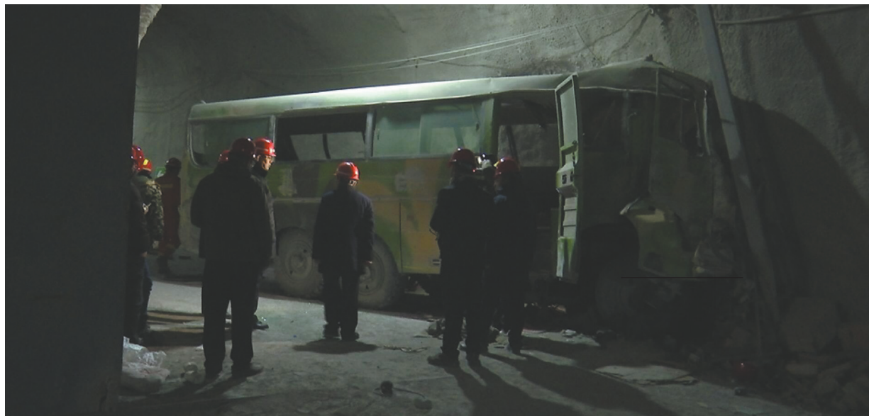
2月23日拍摄的内蒙古锡林郭勒盟西乌珠穆沁旗银漫矿业有限公司井下车辆事故现场。

据央视新闻报道,此次事故已造成21人死亡,其中15人当场死亡,1人在送往医院途中死亡,4人在医院救治过程中死亡,1人于2月24日凌晨死亡,其余29名伤者正在接受救治。