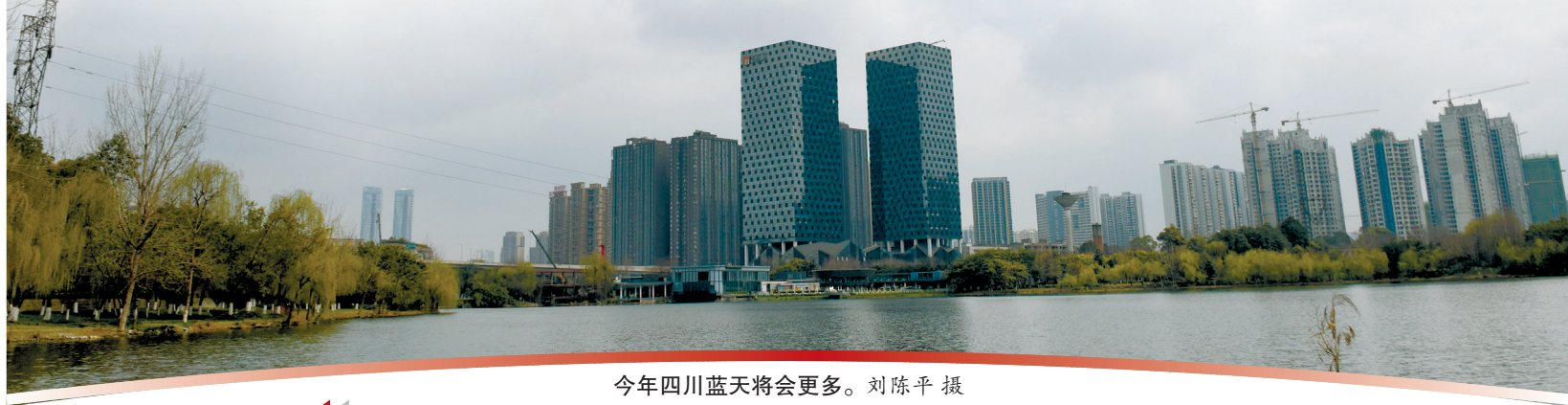
今年四川蓝天将会更多。

1月25日,记者从全省生态环境保护工作会议上获悉,2019年是打好污染防治攻坚战的关键之年,这一年,落实全省污染防治攻坚战八大战役实施方案,推动生态环保督察发现问题整改,推进生态环保机构垂直管理改革……毫无疑问,四川的生态环境保护工作正面临新的机遇和挑战。