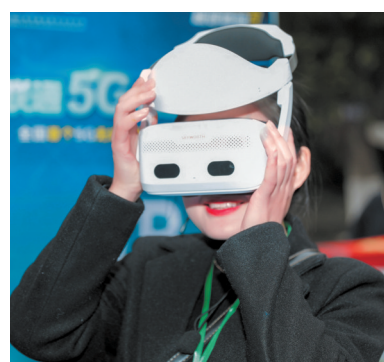
市民通过5G网络现场体验VR看成都。

1月25日,成都联通联合成华区政府在东方明珠花园宣布,全国首个5G无线家庭宽带示范小区正式推出。未来,双方还将共建基于5G的一站式综合服务平台,打造5G智慧社区。