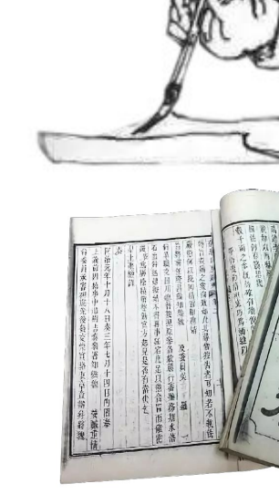
《存马山房疏草二卷》复印本。

清咸丰八年(1858),赵树吉得知英法联军舰沿海北上,即上《请严备海防疏》,提醒咸丰帝备战,以防英法联军经天津武备进京。