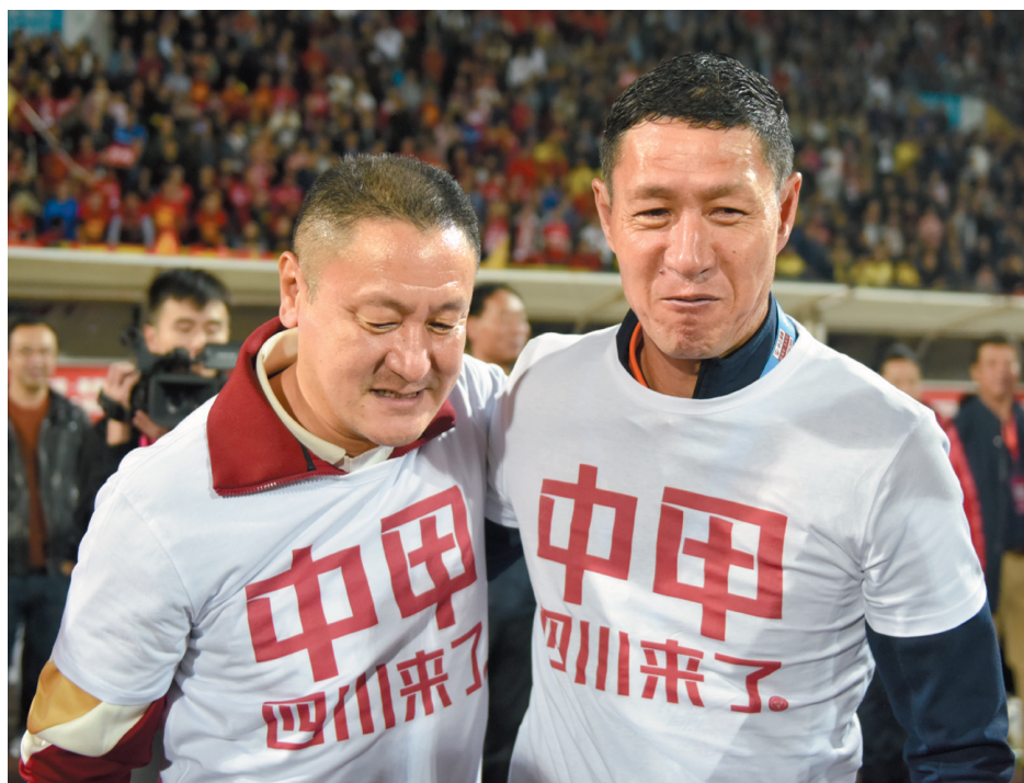
2018年10月27日,中乙半决赛,四川安纳普尔那在都江堰主场冲甲成功。(资料图片)