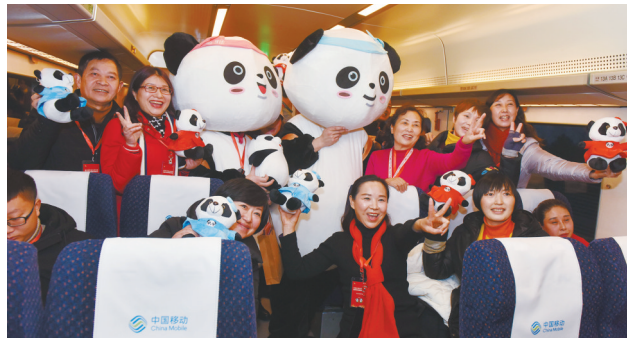
2018年12月28日成雅铁路首发动车,车上的熊猫元素吸引游客关注。