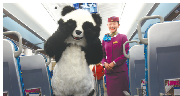
2018年12月29日上午10点04分,(CRH6A-A)动车组从安靖站发车,“大胖子”动车首跑成绵。