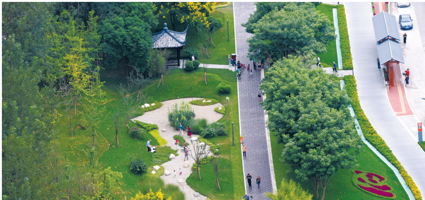
成都三环路熊猫绿道。