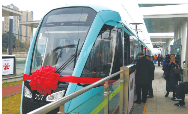
2018年12月26日,蓉2号线有轨电车试运营。

记者了解到,在压减燃煤方面,成都市实行重点企业错峰生产,基本完成燃煤锅炉淘汰,餐饮门店清洁能源改造入选联合国教科文组织推广案例。在控车减油方面,成都市对7.8万余辆柴油货车及工程车辆进行了路检、场检,并在全国首创工程车辆(非道路移动机械)标志管理,划定高排放工程车辆禁止使用区;成都市新建电动汽车充电桩1805个,新投入运营新能源公交车1456辆。在治污方面,成都市对水泥、平板玻璃、火电厂等重点行业实施超低排放改造,查处30家抽检不合格的加油站,完成49户造纸、印务、建材等落后产能淘汰。同时,在清洁降尘方面,成都市对1779个符合条件建设项目安装扬尘在线监控系统,关停、拆除无资质(含临时站点)混凝土搅拌站128个,城市建成区道路机械化清扫率达到90.92%。