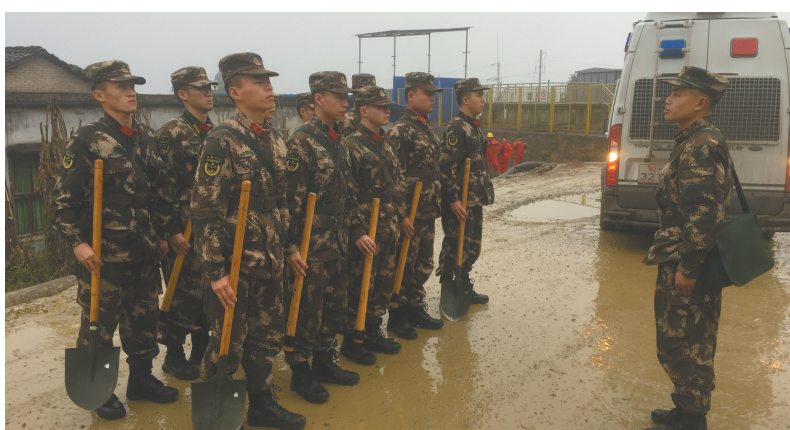
1月3日，武警宜宾支队第一时间出动人员赶赴震区救援。