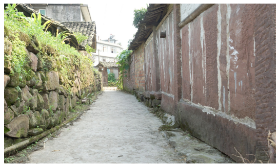
位于天全县破磷村的石头寨。