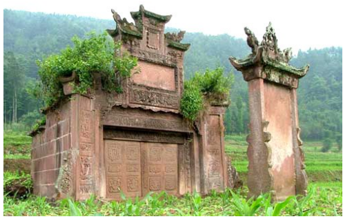
土司遗址残存的牌坊。