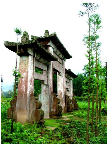
土司遗址残存的牌坊。