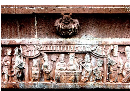
土司遗址精美的石刻。

大西刀锋转向邛州,城内百姓惊恐万状,为此跪求当地官员,希望他们献出官印以保全地方。雅州知州王国臣准备投降大西,逮捕了从邛州逃跑过来的官员胡恒、阮士奇以及他们携带的3颗官印。高继光闻讯,立即发兵二千,进攻雅安的王国臣。雅安城被攻破,王国臣败逃,后来辗转到了成都,受张献忠封为“茶马御史”。高、杨二土司将胡恒等官员迎入始阳镇暂住。这就是大西国语境里的“雅州兵变”。