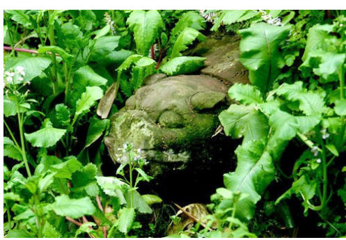
土司遗址外埋没荒草的石龟。