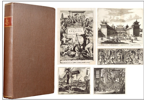
安文思《中国新史》,1671年伦敦版。约翰·奥格尔比译著,硬皮精装插图本。