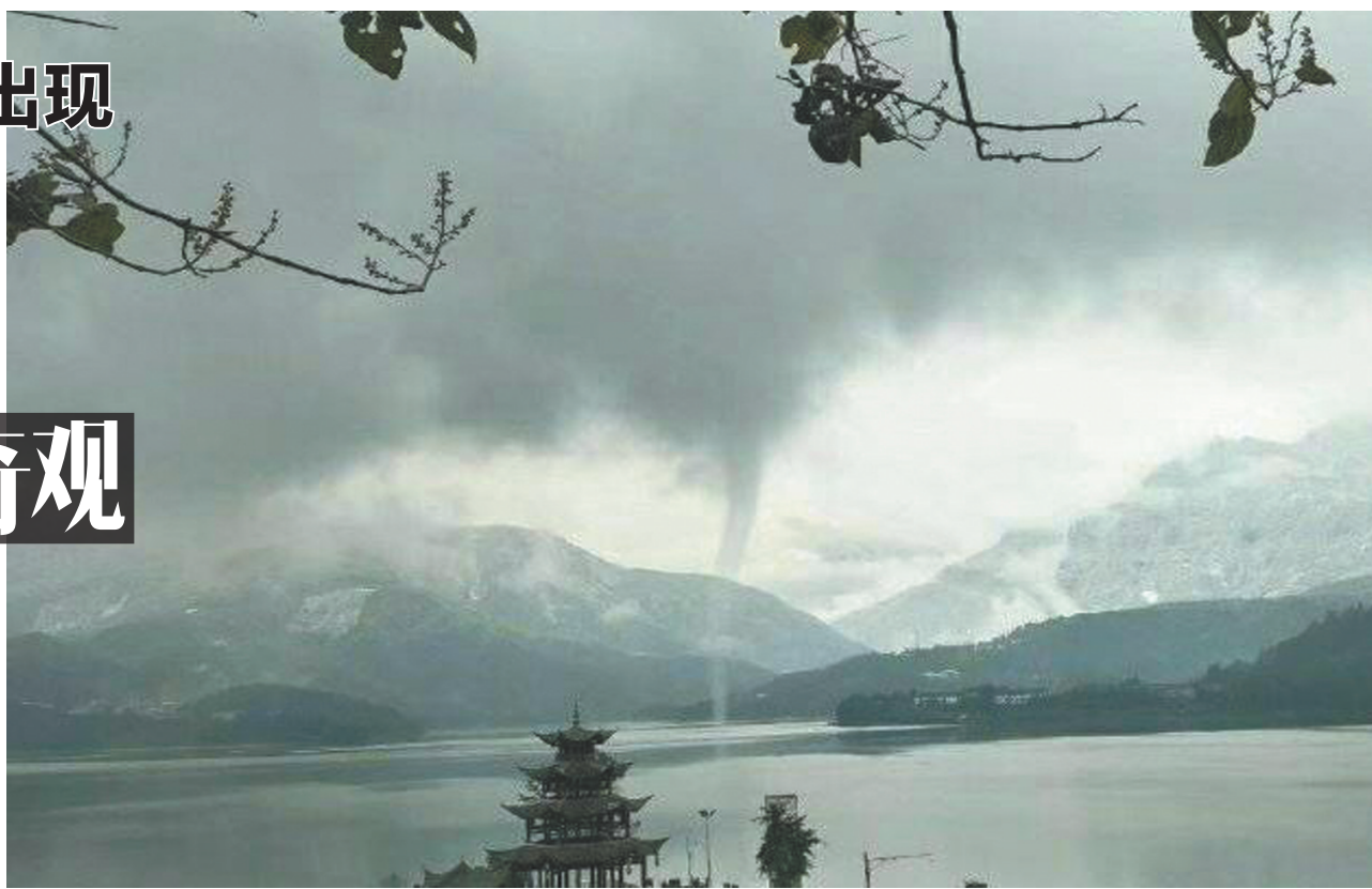
11日上午,洪雅县雅女湖出现“龙吸水”奇观。

12月12日,一则洪雅县雅女湖“龙吸水”的奇观视频,在网上传开。大家在惊讶的同时,纷纷猜测“龙吸水”的原因,各种说法扑面而来。洪雅县气象台台长罗凝谊说,“龙吸水”实际上就是水上龙卷风,但是这种现象一般出现在较热的季节,在冬天看到“龙吸水”非常罕见。“我们查了下相关资料,之前没有发生过这样的现象。”