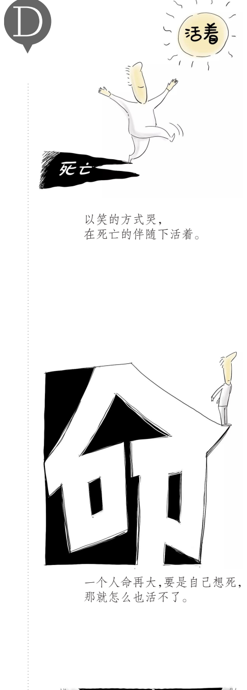
以笑的方式哭，在死亡的伴随下活着。