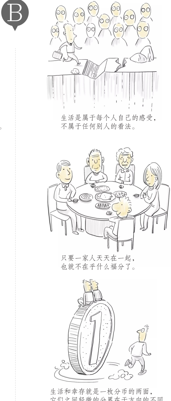
生活是属于每个人自己的感受，不属于任何别人的看法。