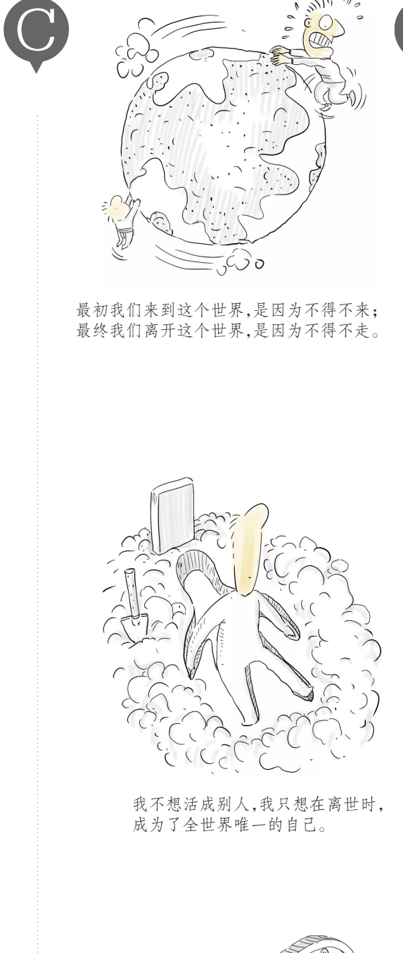
最初我们来到这个世界，是因为不得不来；最终我们离开这个世界，是因为不得不走。