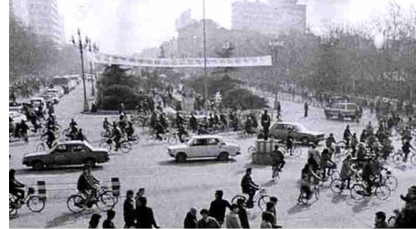
▲上世纪90年代的天府广场一侧。