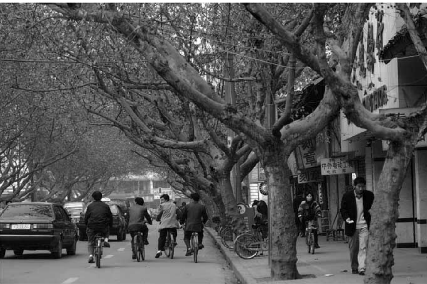
▲上世纪90年代的南大街。