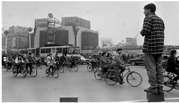
▲上世纪90年代的人民商场。