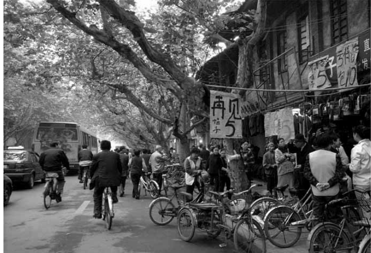
▼上世纪90年代的西大街。