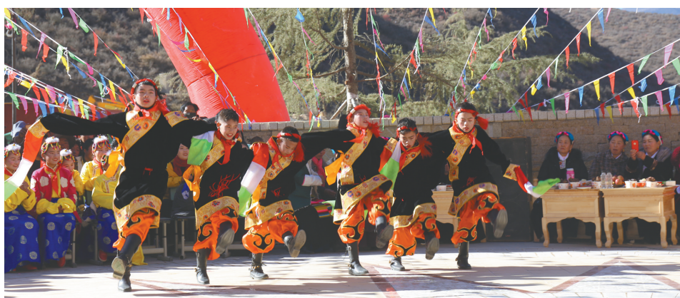
大家用欢快的舞蹈表达喜悦的心情。