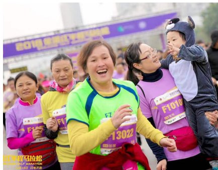
“家门口”的比赛好安逸。