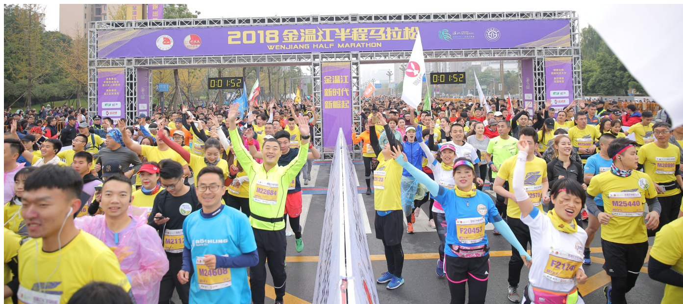
2018金温江半程马拉松赛欢乐起跑。

4000年厚重的鱼凫文化和舒适怡人的自然环境，让“金温江”成为众多跑友心中的打卡目标。