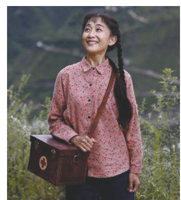
陈瑾的演技很出色。