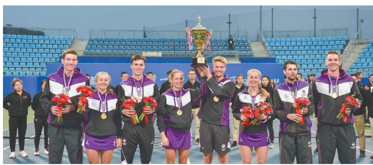
英国拉夫堡大学队在“一带一路”网球赛夺冠。

2018年，从成都国际网球挑战赛开始，到ATP250成都公开赛，从ITF青年大师赛，再到“一带一路”国际大学生网球邀请赛，成都网球季再次丰富了自己的外延。