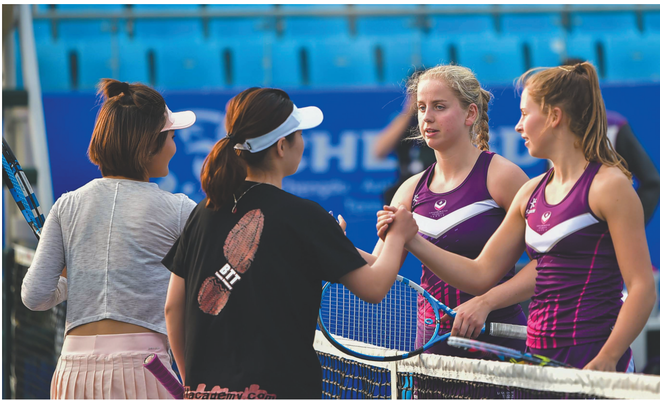
成都网球季在友谊的氛围中告别2018年。