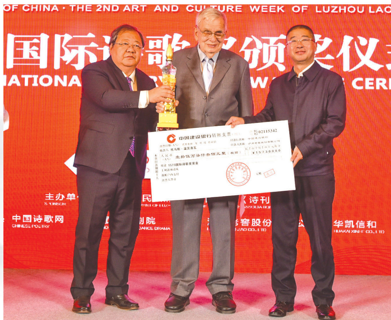
为立陶宛诗人托马斯·温茨洛瓦(中)颁奖。 著名诗人、中国作家协会副主席、书记处书记吉狄马加(左)

近些年,国内“诗歌热”方兴未艾,以诗为媒,展开国内、国际文化交流,正成为一股强劲的文化风潮。从全民参与的国际诗歌周/诗歌节、到沙龙式的小型朗诵会,让诗歌这一原本较为小众的文学形式,越来越走进大众文化生活。仅在2018年10月,国内就有上海国际诗歌节、武汉东湖诗歌节、马鞍山李白诗歌节、重庆“中国·白帝城”国际诗歌节、海宁志摩诗歌节、张家界国际旅游诗歌节等不下十场诗歌节活动。在具有悠久诗歌传统和良好诗歌生态的四川,诗歌活动数量之多,格调之高,更是不遑多让。2018年10月,继自贡国际诗歌周、成都巴黎诗歌双城会之后,第二届国际诗酒文化大会——中国酒城·泸州老窖文化艺术周,在泸州圆满落下帷幕。17日晚,在第二届国际诗酒文化大会上首次设立的“1573国际诗歌奖”,被授予“东欧文学三杰”之一、立陶宛诗人托马斯·温茨洛瓦。