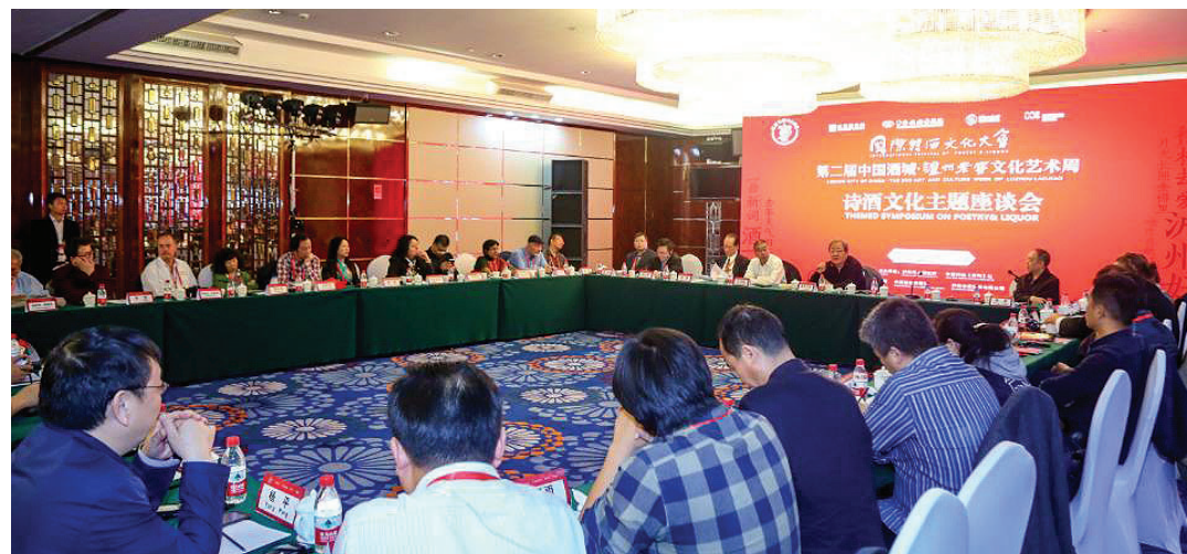
诗酒文化主题座谈会。