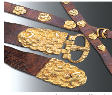
虎豕咬斗纹金带饰牌。