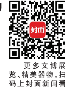
更多文博展览、精美器物,扫码上封面新闻看精彩视频。