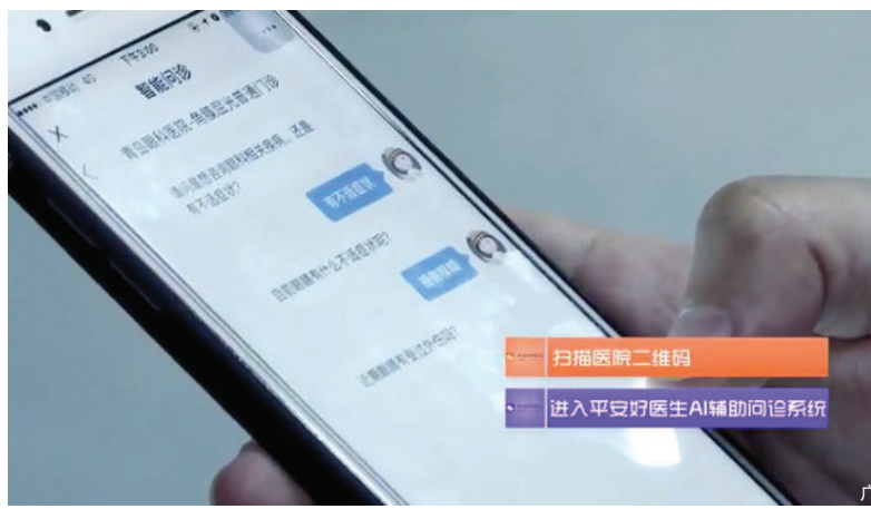
平安好医生AI辅助问诊系统

合作中,平安好医生划时代的智能辅助问诊系统“AI Doctor”与医院HIS(信息管理系统)、手机App、微信公众号进行了全面打通对接。患者扫码进入“AI Doctor”系统后,通过简单便捷的人机交互,其主诉、现有病史、既往病史、用药史、过敏史等信息就能被“AI Doctor”智能采集并写入医院HIS系统中。医生在接诊过程中,可以提前查看患者的结构化病例信息,有针对性地进行补充问诊,不仅节省了重复问询患者相关问题的时间,还规范了问诊路径,避免有效信息遗漏。同时,医生还能从繁重的手工录入中解脱出来,工作强度大为降低,有效提升了问诊效率和准确率。