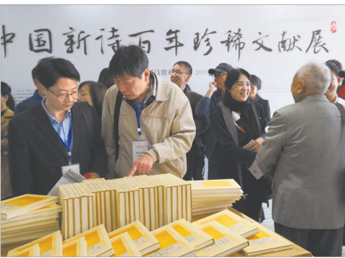
与会嘉宾参观中国新诗百年珍稀文献展。

任日本郭沫若研究会名誉会长、世界郭沫若研究会顾问。岩佐昌隆教授搜集到多种中国文学作品及相关研究著作，对郭沫若的母校四川大学更怀有特别的景仰，他无偿捐赠的重要藏书，绝大多数是中国1950—1970年代间出版的文学读物及相关的研究著作，系统而全面，目前在国内已少有如此完整的收藏。