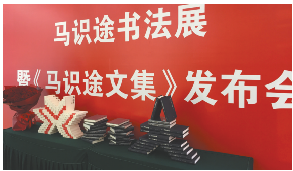
10日，马识途文集共18卷亮相北京中国现代文学馆。