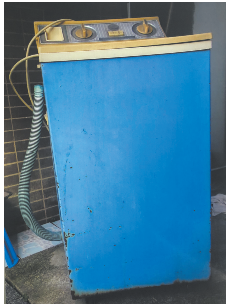
天使牌单缸洗衣机。

为筹备展览，现在面向社会公众征集“记忆”。如果你还珍藏着光阴的“老照片”，如果你还保留有岁月留痕的“老物件”，请把“它”和“它的故事”交给我们，让我们共同讲好温暖人心的“四川故事”。成功入选后，还有丰厚奖金等你哦！