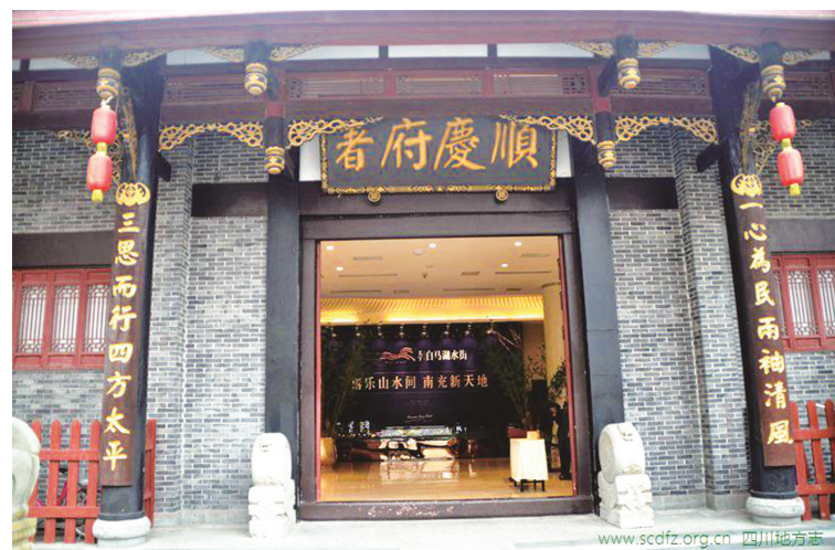
恢复重建仿明清建筑的顺庆府署。

顺庆自古享蚕桑丝绸之利，得大道交汇与嘉陵江水道之便，唐宋时期，除传统的桑蚕丝绸业外，金属铸造、加工业也相当发达；城市商贸活跃，经济繁荣，吸引四方商贾，人文荟萃，已经成为继成都之后的东川首府和川东北经济文化中心。在北宋时期许多诗文中，以“小益”（小成都）代称此地。著名理学家邵雍之子邵伯温曾任果州知州，政务闲暇时写了数十首反映当时果州本地市井生活及民风民俗活动的诗词。在《充城好词》描述：“巴子旧封，充城乐土，江山秀润，民物阜繁。胜概居多，灵踪相属。”题诗赞曰：“山围翠合水重云，万户楼台照眼明，胜地风淳真乐国，四川惟说好充城。”“自昔充城号奥区，蜀人唤作小成都”。