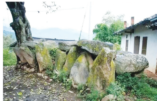
德昌县六所镇永兴村大石墓。