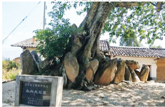
永兴大石墓。