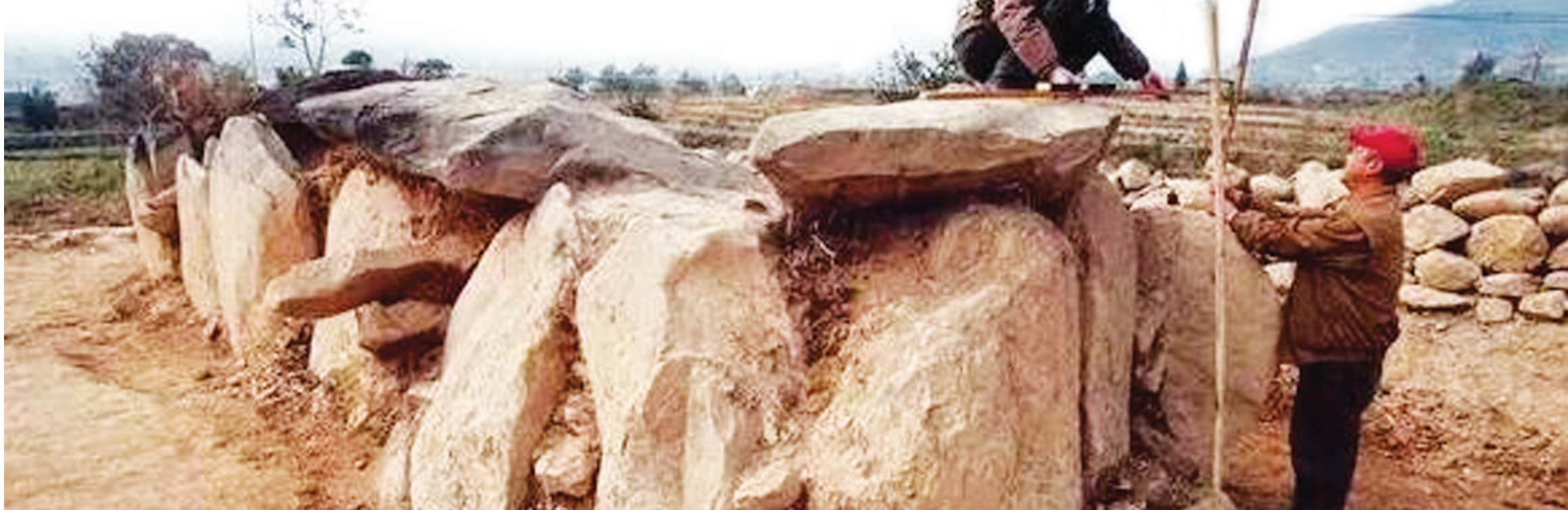
2004年,德昌县德州镇阿雍村大石墓发掘现场。

当地老乡称这种巨石砌成的坟墓为月鲁坟,而彝语老乡叫它们“濮苏乌乌”,说是彝族的祖先进入凉山前就居住在这里的一种矮人的石头房子。考古学家认为这是新石器时期的遗址。说法各异,真相无人得知。我们用“还原法”思考大石墓这个难题,发现“滚木”和“杠杆”是揭开谜底的钥匙,大石墓的主人是古代邛人。