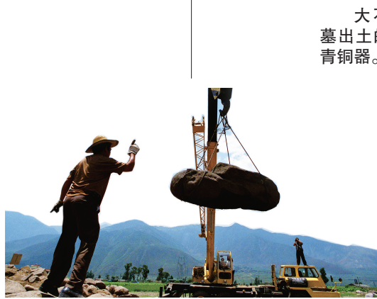
凉山大石墓发掘现场。