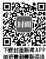
封面 下载封面新闻APP 浏览最新资讯

近期以来，金牛区纪委监委锁定改头换面的“四风”新动向、新表现，紧盯违规使用公车、违规公款吃喝、违规使用公款购买高档礼品及购物卡等问题，不断探索改进监督方式，运用联合督查、延伸检查、实地暗访调查、信息平台数据筛查等方式，以钉钉子精神持续正风肃纪。