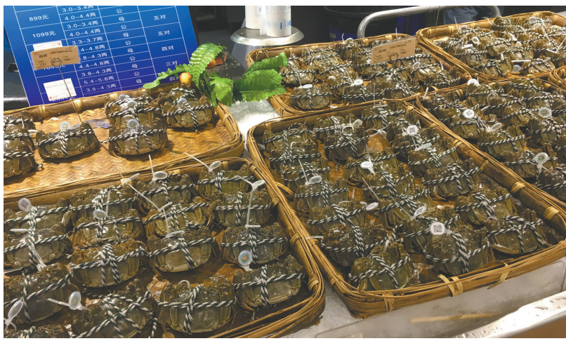
大闸蟹热销，但大闸蟹蟹券却遇冷。

金秋十月，正是品尝大闸蟹的好时节，大闸蟹礼券也是走亲访友最方便携带的礼券。和月饼券类似，“纸螃蟹”也需要提前购买、凭券提取。但一向火爆的礼券回收生意，今年却遇了冷，面值千元的蟹券回收价不到2折，成都不少“黄牛”今年都拒收“纸螃蟹”，称“收了也卖不出去”。