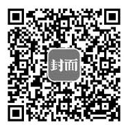
扫二维码 看本文视频