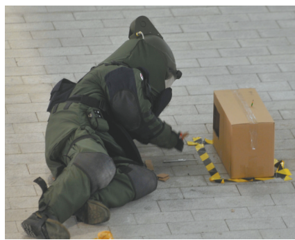
特警正在进行排爆科目比赛。