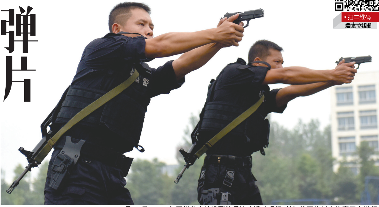
9月12日，2018年四川公安特巡警练兵比武活动现场，长短枪互换射击比赛正在进行。