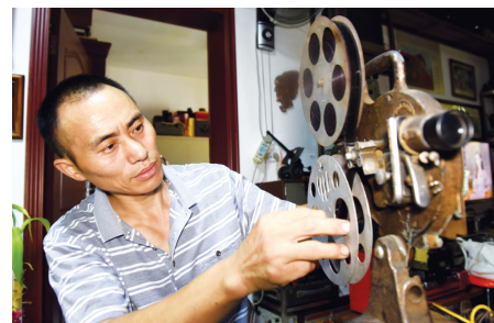
文先生收藏的第一部美国柯达无声电影机。