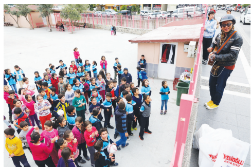
在土耳其马尔马里斯，给孩子们唱歌。