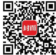
扫码上封面 看本文视频