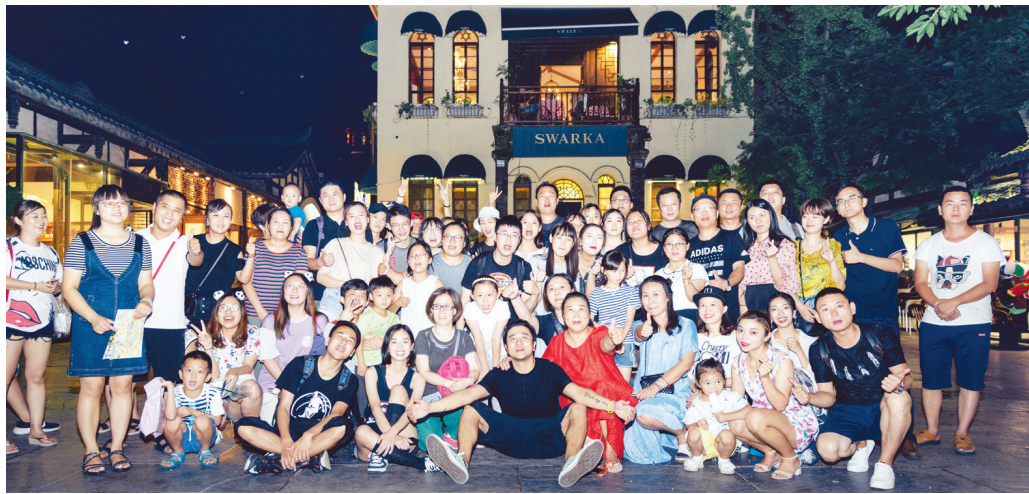
在成都宽窄巷子演出后和歌迷合影。