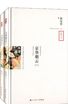
林语堂的《京华烟云》原著其实是英文版。

20世纪60年代后期，一次张大千由巴西路过纽约去欧洲办画展，他特别买了一个新鲜肥大的鱼头来拜访老朋友——林语堂。林夫人将鱼头做成一道红烧鱼头菜，林语堂的千金相如也做了一道时鲜菜肴——“焗烧青椒”来招待这位从巴蜀走出来的艺术大家。林语堂平时不喝酒，老友重逢实在难得，特意开了两瓶台湾花雕酒助兴。酒过三巡，话匣打开。他们回忆起1944年初，林语堂来到成都，张大千刚好从敦煌莫高窟临摹壁画回到蓉城，四川省主席张群特意为他们俩接风洗尘。陪客有著名诗人、书法家沈尹默等，沈尹默与林语堂是老友，阔别多年，相谈甚欢……沧桑巨变，不觉一晃20多年过去了，两人抚今追昔，感慨万千。