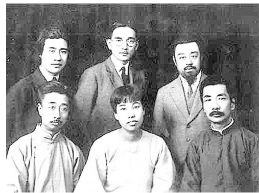
前排左起：周建人、许广平、鲁迅；后排左起：孙福熙、林语堂、孙伏园。