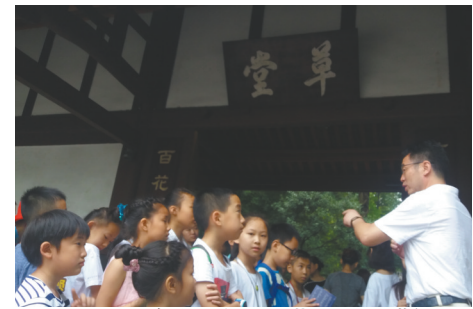
海光老师现场指导小小讲解员。

7月31日，由成都杜甫草堂博物馆、阿里巴巴天天正能量、联合华西都市报、封面新闻主办，联海文化协办的2018“广场经典诵读”走进杜甫草堂如期举行。四川电视台主持人、四川省视协主持人专委会秘书长海光老师，与20多位华西都市报、封面新闻的小读者，一起聆听了杜甫草堂小小讲解员们的讲解，并齐聚仰止堂交流了经典诵读。