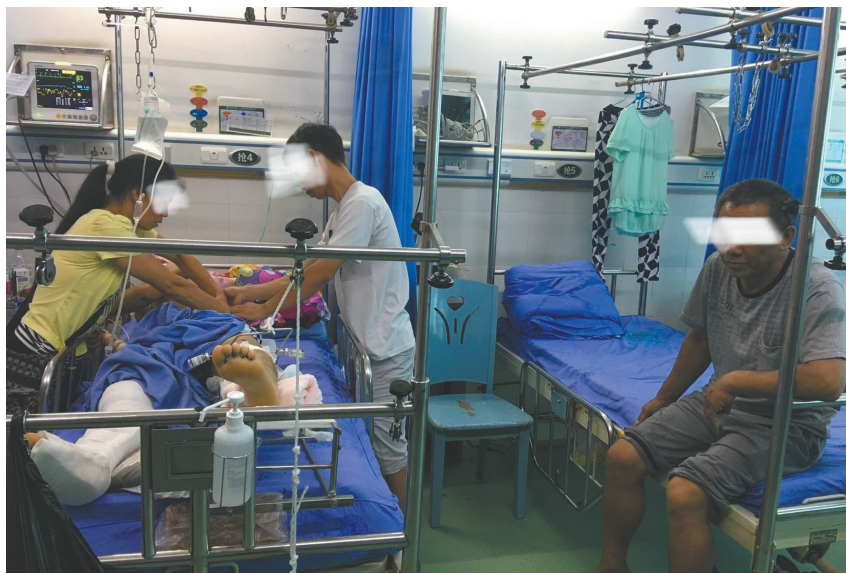
白色别克私家车上上的伤者在医院接受治疗。

那么,这起交通事故当时究竟是什么情况?事故责任如何认定?共享汽车公司的工作人员是否说过这些话?肇事者究竟会不会开车、有没有驾照?别克轿车的当事人和电瓶车当事人医药费该如何赔偿……带着这些疑问,7月25日,华西都市报·封面新闻记者进行了多方走访。