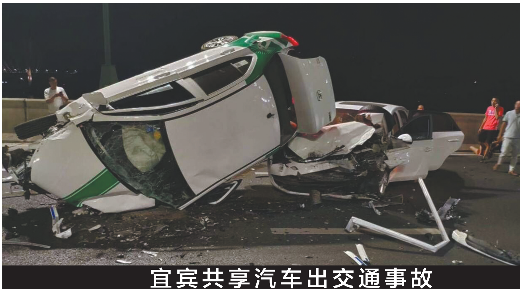
宜宾共享汽车出交通事故