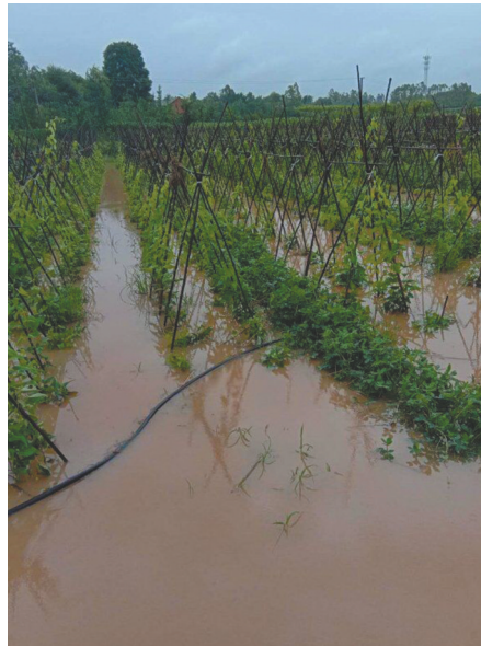
成都周边区县蔬菜基地被淹

国家统计局成都调查队的分析认为，本次受灾影响最大的是本地蔬菜。本地菜地被淹，蔬菜受损，农户出菜少，导致收购商进货少，批发市场出现商贩“抢菜”现象。特别是依附于地面生长的茎叶菜容易被水淹，像生菜、空心菜、丝瓜、豇豆、四季豆等蔬菜受雨水浸泡易腐烂、品相不