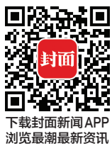
下载封面新闻APP 浏览最新资讯