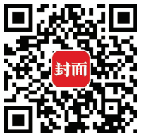
张艺谋、姜文、周星驰、王家卫的配乐有多好听，扫码上封面新闻看视频。