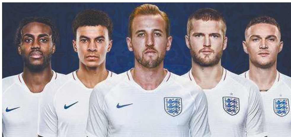
英超球星“霸占”世界杯。

三人组，以及来自利物浦的替补门将米尼奥莱。此外，比利时队中还有一名来自英超的球员。