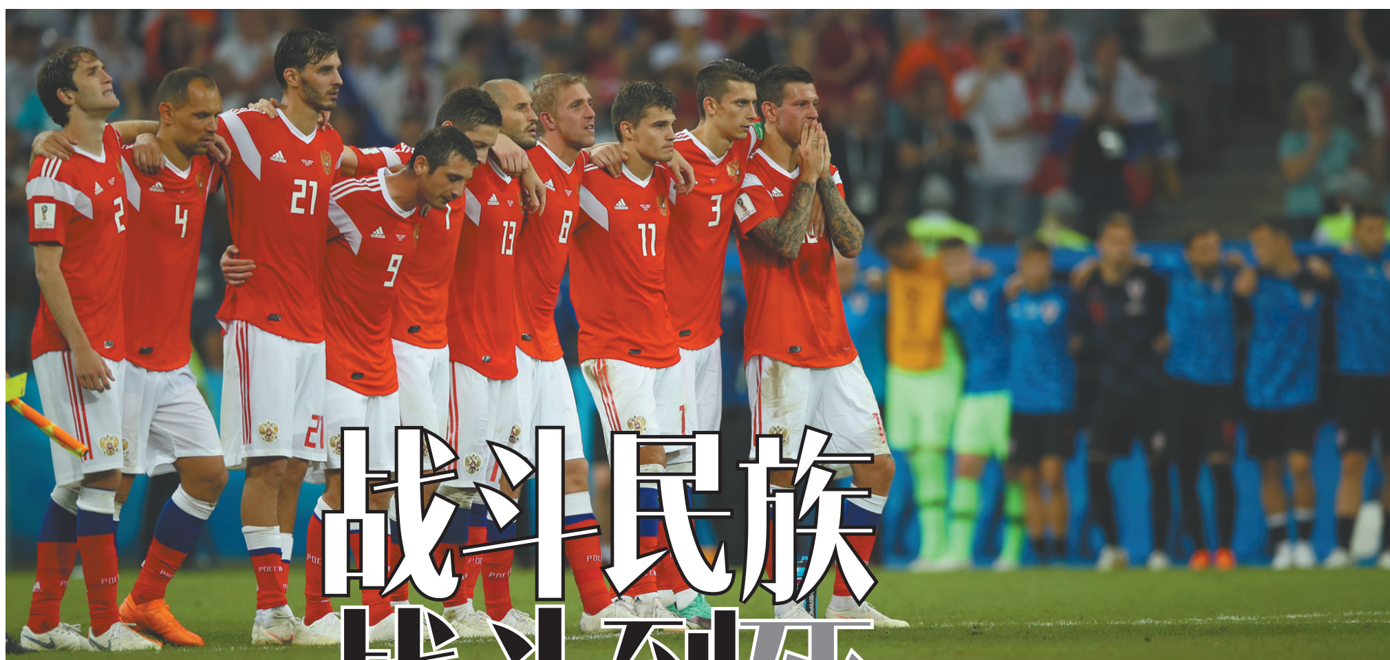
七月七日，俄罗斯队球员在队友射点球后。