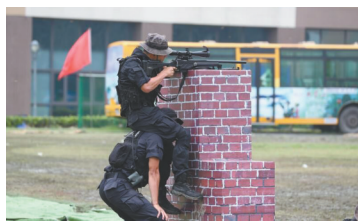
◀特警合作组击演练。