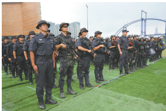
集结完毕,特警准备演练。