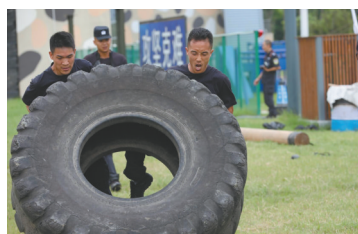
◀两名队员合作翻滚300斤的轮胎。