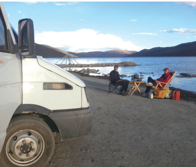
旅行途中，父子俩享受落日余晖。