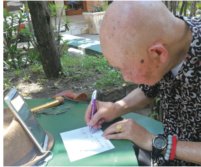
每次出发前，刘森道老人都要做攻略。