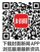
下载封面新闻APP 浏览最新新闻资讯