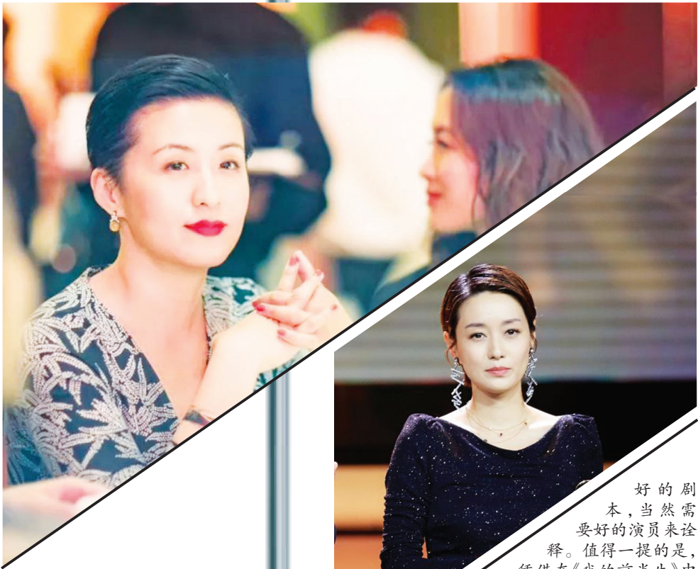
马伊琍获得上海电影节视后。