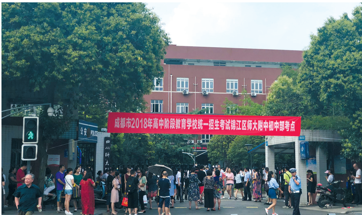
2018成都中考师大附中初中部考点。