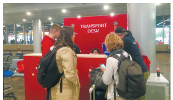
莫斯科机场出口处的世界杯官方交通问讯处。