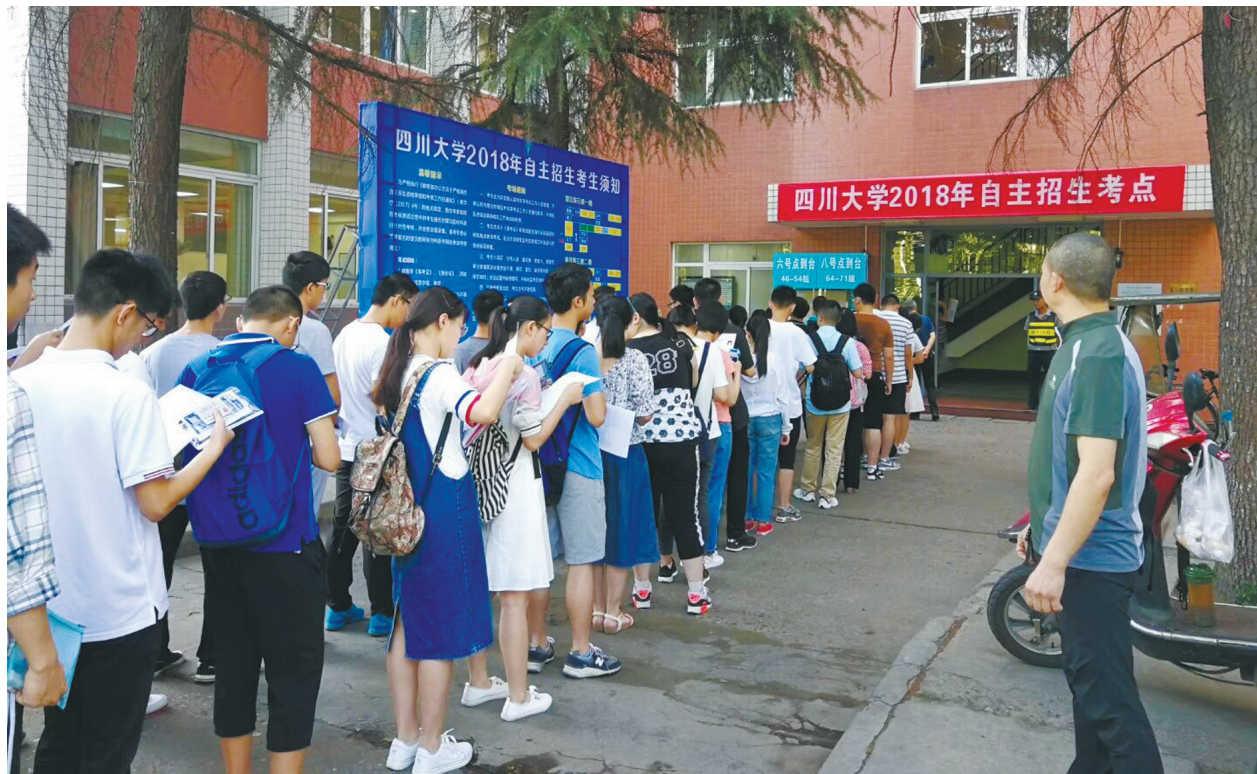
四川大学自主招生考场。

为了保证考试的公开公平公正,专家现场随机分组,实行独立打分。而且考场内实时录音录像,以保证没有任何“开后门”的空间,而且凡是直系亲属要参与自主招生考试,相关专家不能参与出题以及面试。此外,写了专家推荐信,也不能参加自主招生。