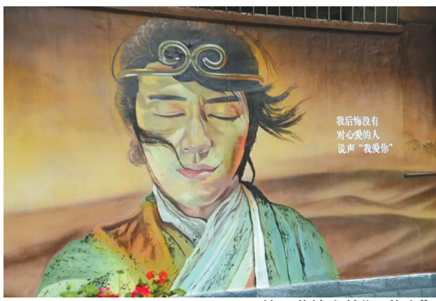
玉林四巷墙上的“至尊宝”。