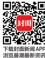
下载封面新闻APP 浏览最新新闻资讯

四川已成为中国西部吸引外国留学生发展最快、最有发展潜力的省份。2010年至2016年,四川外国留学生人数从仅仅4407人增长至10796人,六年间增长2.5倍,四川外国留学生人数居西部地区第三位。表明四川对外国留学生吸引力显著增强。