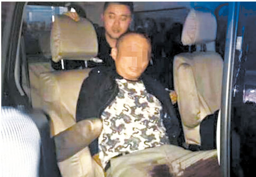
犯罪嫌疑人被警方制服。

据知情人士透露,在高速公路收费站报警之前,坐在出租车后排的人,曾在万源出口下高速前通过他人报过一次警。“坐在副驾驶的男子,就是后来持刀反抗民警的男子。另外两名男子,一人负责驾驶,另一人坐在后排。”