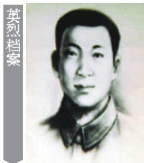
贺锦斋像(资料图片)

贺锦斋,1901年生,名文绣,乳名春生,湖南桑植人。1916年贺龙两把菜刀闹革命,组织讨袁(世凯)护国军的壮举,为贺锦斋所敬仰。1919年入贺龙部当卫士,由于作战勇敢,由士兵逐级晋升至团长。