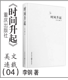
美文连载 (04) 李钢著

日本投降前两年,有人从南方跑回老家,带回了父亲的死讯。说是目睹了新四军打鬼子的场面,在死人堆里亲眼看见父亲的尸体。说得有鼻子有眼。这个误传对奶奶的打击无疑是沉重的,数日之内,她的眼睛完全瞎了。她请人制了我父亲的牌位,供在屋里。但是不久,她又摸索着开始做鞋,一双一双地做,没人敢劝阻她。做成的鞋,她都放在我父亲那间屋的炕上,却再不托人捎走。奶奶仿佛已经绝望,又分明心存一线希望,尽管这希望十分微弱。她大概也说不清,做这些鞋究竟是要等儿子活着回来穿,还是要送他在黄泉路上走。我父亲的自传里写着,那一阵与鬼子的战斗,有几仗打得确实很恶,他九死一生。全国解放后我父亲在北京治伤,即给老家去了信,离开这么多年,他也不知家里人谁死谁活。这封信轰动了—个村子,唯独奶奶不信,以为是人编出来哄她,因此我爷爷戴上瓜皮帽穿着长袍子去北京探个究竟。爷爷见了我父亲的头一句话是:“娃,你媳妇你盼瞎了眼。”看到那种能摇起摇下的病床,他又说了第二句话:“娃,怨不得你不写信不回家,睡了这么好的床,你还不想咱家的炕。”说完就气呼呼地回去了。我父亲伤未痊愈就出院赶回老家。父亲在他屋里见到了小山似的一堆鞋,一辈子也穿不完。他捧出一双带回来,保存在箱子里。我成年后试过那双鞋。四十三码的脚伸进去前面还空一截,比我矮半头的父亲根本不能穿。我想这或许是由于奶奶双目失