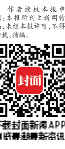
请下载新闻APP 浏览更多精彩内容