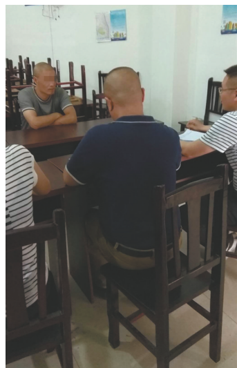
当哥的何某接受乐山运管部门调查。

与此同时，有关方面对监控视频的来源展开调查。“隐私视频被泄露和广为传播，泄露者和传播者都涉嫌侵权行为。”律师提醒，网友在传播信息时，要防止涉及他人隐私。