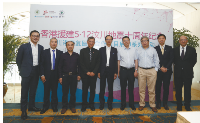
“香港援建‘5·12’汶川地震十周年纪念暨川港康复医疗合作项目启动系列活动”在成都正式启动。

“存公益、诚信、和平、喜乐、慈爱、谦卑、感恩之心”，顾连医疗在推动川港合作，提高康复医疗水平的同时，在5月12日与上海星旭公益基金会共同启动了顾连康复专项救助计划，凡经济困难的疑难复杂功能障碍患者都可以申请此项计划，申请审核通过后即可获得基金救助。此外，顾连医疗还将与上海星旭公益基金会合作成立顾连康复公益基金，为家庭困难的疑难复杂功能障碍患者提供公益救助补贴。