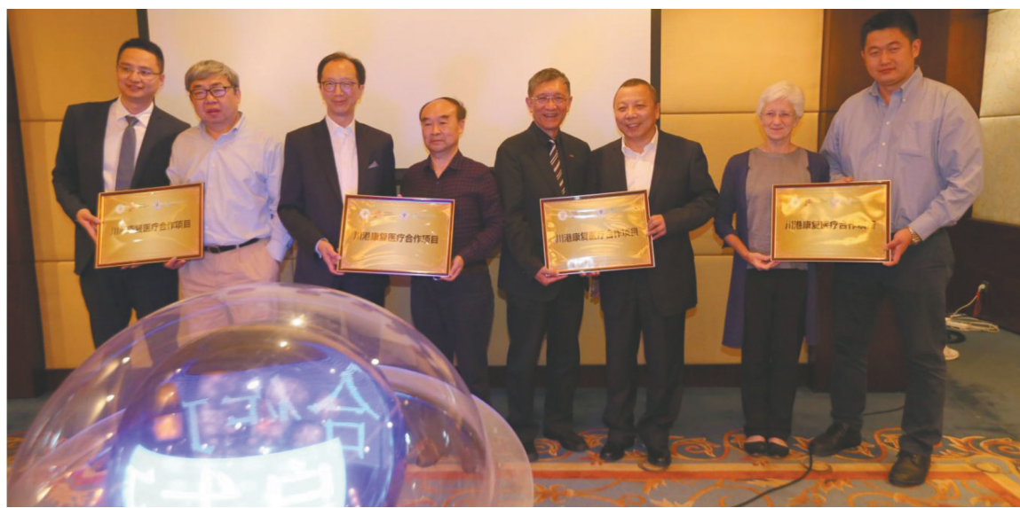
川港康复医疗合作项目正式启动。