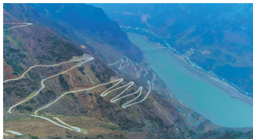
凉山州金阳县金沙江畔,一条曲折的公路盘在山间,成为山上众多村寨的致富路。