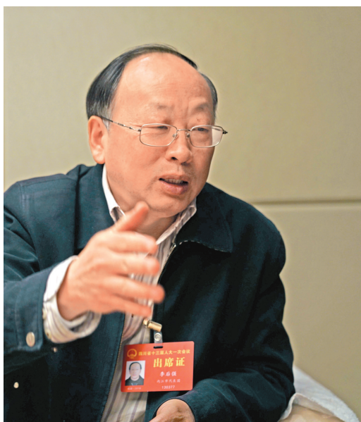
省人大代表、四川省社科院党委书记李后强。