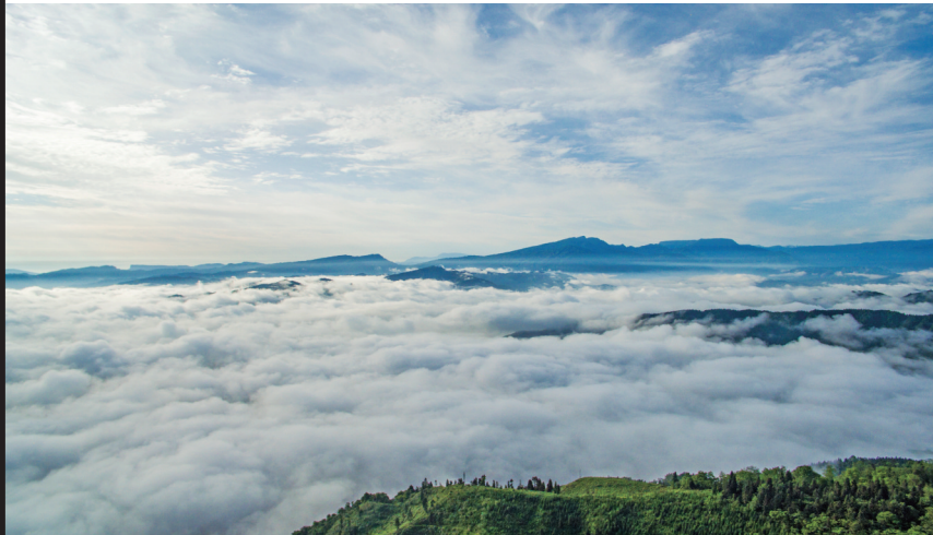
莲顶山为铜山之巔。