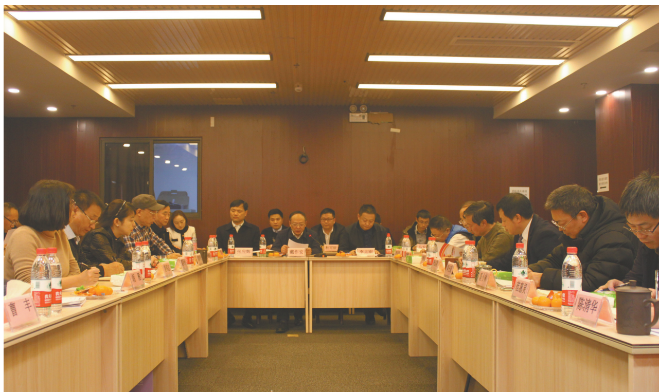
会议现场。