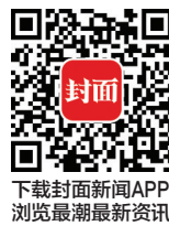
下载封面新闻APP 浏览最新资讯

药筛选方法，筛选明确具有抗病毒作用的中药189种，从中选择“抗病毒之王”绵马贯众，“经典抗病毒”金银花等经过严密组方、科学配伍、严谨的药理、临床实验研制成功的新药型抗病毒中成药。