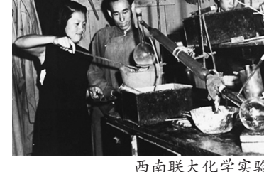
西南联大化学实验室。