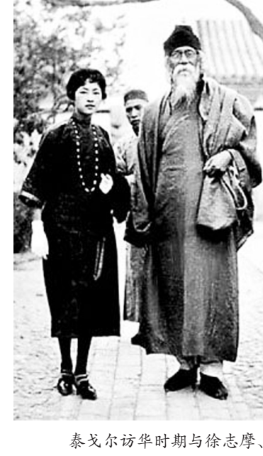
泰戈尔访华时期与徐志摩、林徽因合影。