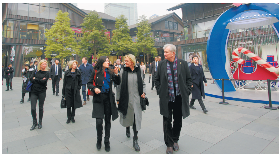
1月11日,北欧和波罗的海6国议长代表团考察太古里。

第一次来四川的挪威议长乌勒米克·托马森对天府新区的所见所闻印象深刻。他说,中国经济发展给挪威提供了很多机会。然而,挪威目前的主要关注点在中国沿海地区。这次四川之行给他提了醒:挪威应该更多关注四川,他相信未来会有更