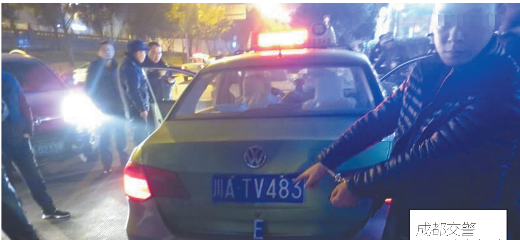
成都交警冬季铁拳行动挡获多辆克隆出租车。

据了解，自成都交警冬季铁拳行动开展以来，共挡获41辆克隆出租车、34名违法人员。其中，已有27人被拘留。值得注意的是，执法人员还在这些克隆出租车里发现了不少假币、辣椒水、跳表器，以及管制刀具等物品。