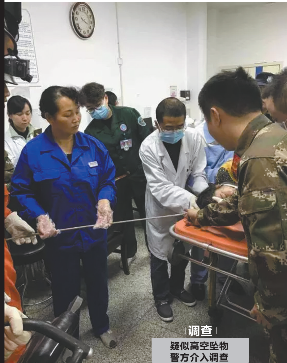
调查 疑似高空坠物 警方介入调查