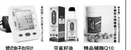
臂式电子血压计 亚麻籽油 精品辅酶Q10