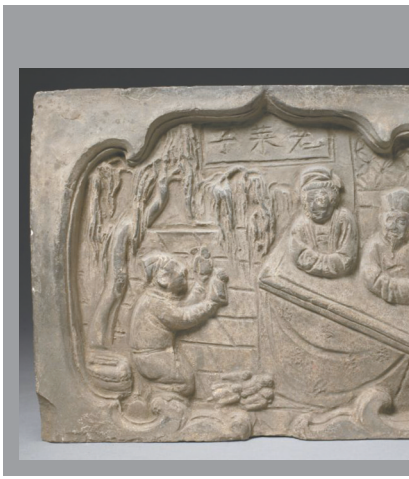
二十四孝之老莱子娱亲砖雕。(故宫博物院藏)

而在古代的农业社会，没有退休金、养老金的古人如何养老？政府对寿比南山的老人有什么特殊政策？有学者研究发现，四川出土的汉代养老画像砖上的鸠杖，就相当于最早的“老年证”，70岁以上的老人持鸠杖享受免劳役赋税、政府发粮酒肉的特权。到公元521年，南朝的梁武帝命令设立“孤独园”，专门收养老人和孤儿。至此，中国历史上出现第一家官办“养老院”，而后历朝历代都有官办、民办背景的养老机构，在家庭养老之外照料孤寡老人。