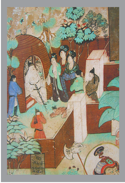
榆林中唐25窟老人入墓图。

“当国庆节和中秋节结伴离去，这个周末，28日，又将迎来一个不放假的汉族传统节日——重阳节。”