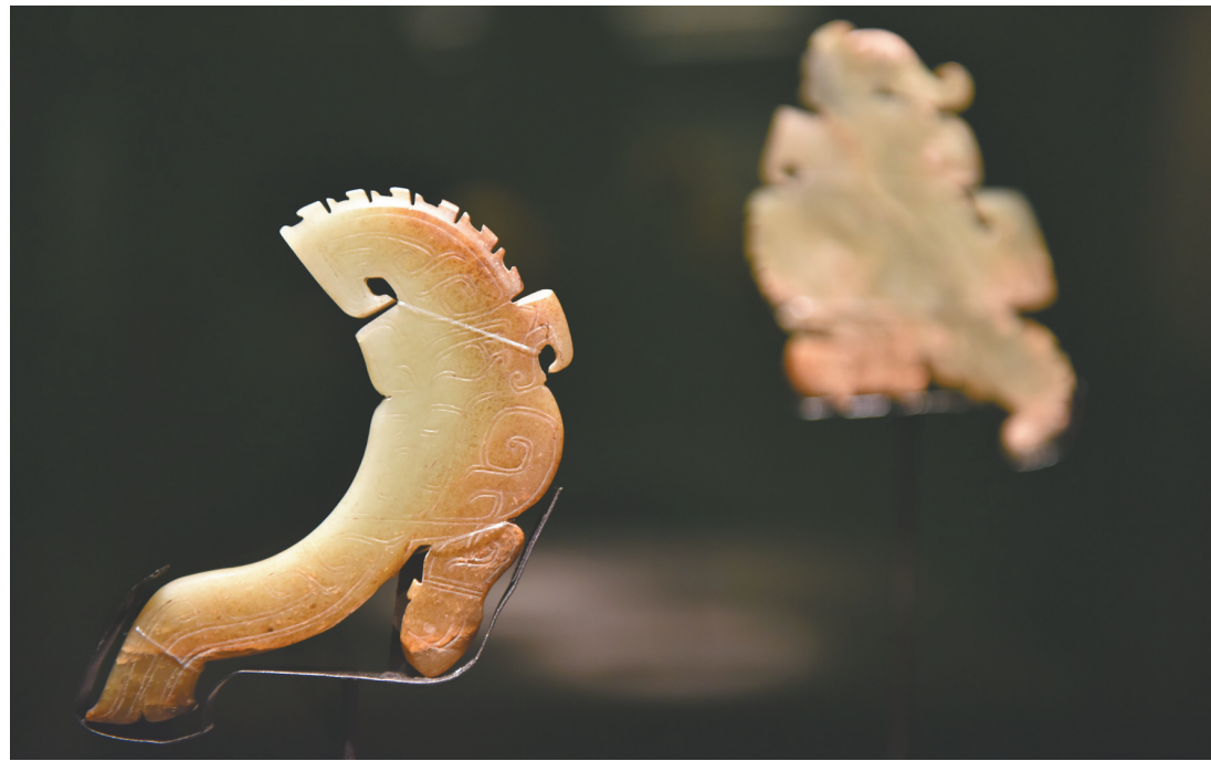
参展的夏商时期玉器精品。

在中国八千年的玉文化历程中，古玉器犹如一位从远古走来的使者，串联起中华文明星光闪闪的点滴。从中原到西北，从黄河下游到长江流域，夏商玉器犹如满天星斗，凝聚了那个时代全部的精华，折射出地域交往的频繁，也反映了古蜀大地自古以来就海纳百川、开放包容的城市气质；而历经岁月打磨的细微痕迹，则揭示出那个年代的精雕细琢。